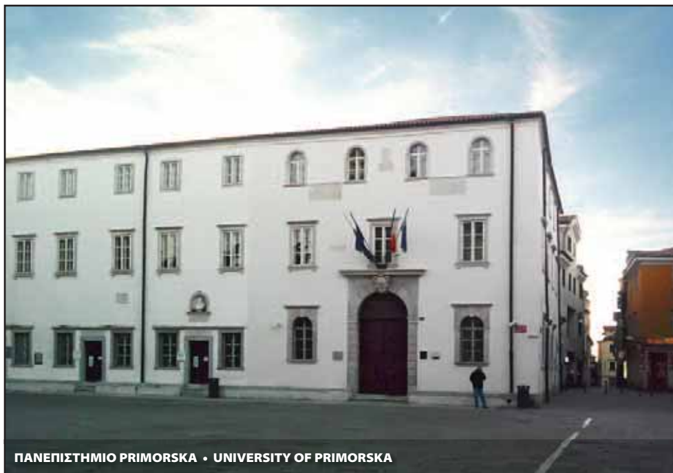
ΠΑΝΕΠΙΣΤΗΜΙΟ PRIMORSKA • UNIVERSITY OF PRIMORSKA

του Συμβουλίου της Ευρωπαϊκής Ένωσης. Συνεπώς, το Ευρωπαϊκό Κοινοβούλιο έχει αποφασιστικό ρόλο στην τελική έγκριση. Επί του παρόντος υπάρχει μια σειρά από νομικά εργαλεία που εξυπηρετούν την παρουσίαση των προτάσεων αυτών. Εργαλεία όπως οι τροποποιήσεις των εκθέσεων που αφορούν τον προϋπολογισμό της Ευρωπαϊκής Ένωσης, γραπτές δηλώσεις της ολομέλειας, γραπτές ερωτήσεις προς την Επιτροπή, ακόμη και αναφορές μπορούν να χρησιμοποιηθούν για να καταδειχθούν τα οφέλη ενός τέτοιου προγράμματος. Το Ευρωπαϊκό Κοινοβούλιο μπορεί επίσης να χρησιμοποιηθεί ως χώρος διεξαγωγής