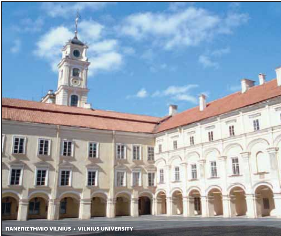
ΠΑΝΕΠΙΣΤΗΜΙΟ VILNIUS • VILNIUS UNIVERSITY

Επιπρόσθετα, το Ευρωπαϊκό Κοινοβούλιο ασκεί έλεγχο επί της Ευρωπαϊκής Επιτροπής και έχει κάποια εξουσία επίβλεψης των δραστηριοτήτων του Συμβουλίου των Υπουργών. Παρακολουθεί τη διαχείριση των προγραμμάτων πολιτικής της Ευρωπαϊκής Ένωσης, μπορεί να διεξάγει έρευνες και δημόσιες ακροάσεις και να υποβάλλει προφορικές και γραπτές ερωτήσεις στην Επιτροπή και το Συμβούλιο. Μέσω των 20 μόνιμων κοινοβουλευτικών επιτροπών του, οι οποίες ασχολούνται με συγκε-