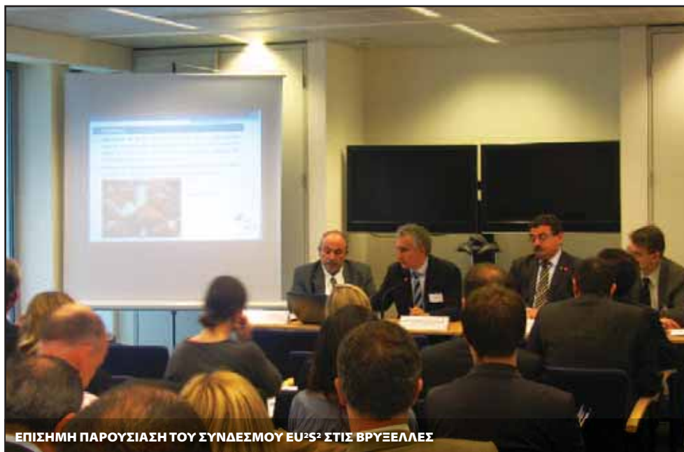
ΕΠΙΣΗΜΗ ΠΑΡΟΥΣΙΑΣΗ ΤΟΥ ΣΥΝΔΕΣΜΟΥ ΕΥ 2 S 2 ΣΤΙΣ ΒΡΥΞΕΛΛΕΣ

υψηλής ολοκλήρωσης και δημιουργικότητας με κίνητρο την αριστεία, ο οποίος συνενώνει τους τομείς της εκπαίδευσης, της τεχνολογίας, της έρευνας, των επιχειρήσεων και της επιχειρηματικότητας, με σκοπό την παραγωγή νέων καινοτομιών και νέων προτύπων καινοτομίας, τα οποία θα εμπνεύσουν άλλους για να μιμηθούν το παράδειγμά της. ΤΟ ΕΙΚΤ συνέστησε τις τρεις πρώτες ΚΓΚ τον Δεκέμβριο του 2009: Climate KIC (έμφαση στην κλιματική αλλαγή), EIT ICT Labs (έμφαση στις τεχνολογίες της πληροφορίας και της επικοινωνίας), KIC InnoEnergy (βιώσιμη ενέργεια).