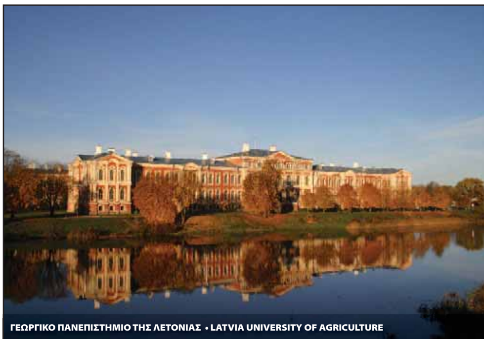
ΓΕΩΡΓΙΚΟ ΠΑΝΕΠΙΣΤΗΜΙΟ ΤΗΣ ΛΕΤΟΝΙΑΣ • LATVIA UNIVERSITY OF AGRICULTURE

Το Ευρωπαϊκό Κοινοβούλιο, μέσω της Επιτροπής Πολιτισμού και Παιδείας, καθώς και μέσω άλλων πρωτοβουλιών, βρίσκεται στην πρώτη γραμμή της χρηματοδότησης των νέων και της εκπαίδευσης, επενδύοντας έτσι στο μέλλον της Ευρώπης. Αυτό έχει τεράστια σημασία, ιδιαίτερα σε καιρούς οικονομικής κρίσης. Επιπρόσθετα, οι «Φίλοι του Ευρωπαϊκού Ινστιτούτου Καινοτομίας και Τεχνολογίας», ομάδα της οποίας είμαι μέλος, η οποία συστάθηκε από την Επιτροπή και απαρτίζεται από περιορισμένο αριθμό ευρωβουλευτών από διαφορετικές πολιτικές ομάδες και διαφορετικές επιτροπές, συνεργάζονται στενά με την Επιτροπή, εξετάζοντας νέες μορφές διακυβέρνησης και τρόπους ενδυνάμωσης του "τριγώνου της γνώσης" της τριτοβάθμιας εκπαίδευσης, της