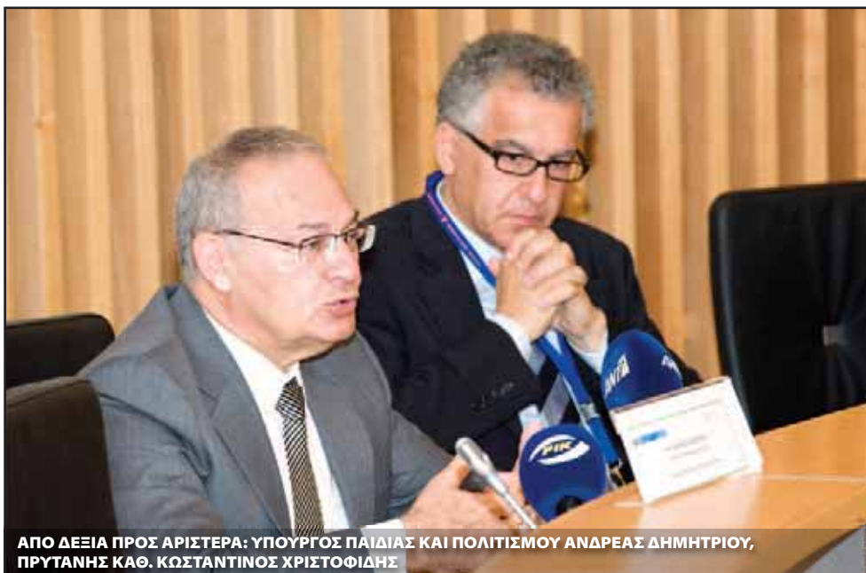
ΑΠΟ ΔΕΞΙΑ ΠΡΟΣ ΑΡΙΣΤΕΡΑ: ΥΠΟΥΡΓΟΣ ΠΑΙΔΙΑΣ ΚΑΙ ΠΟΛΙΤΙΣΜΟΥ ΑΝΔΡΕΑΣ ΔΗΜΗΤΡΙΟΥ, ΠΡΥΤΑΝΗΣ ΚΑΘ. ΚΩΣΤΑΝΤΙΝΟΣ ΧΡΙΣΤΟΦΙΔΗΣ

μεγαλύτερης ποικιλίας προγραμμάτων και της αυξημένης κινητικότητας, της βελτιωμένης καθοδήγησης και της παροχής συμβουλών, της ευέλικτης πολιτικής εγγραφών και των χαμηλότερων διδάκτρων (υποτροφίες, δάνεια, διαμονή χαμηλού κόστους κτλ).