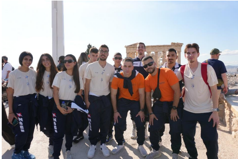
Επίσκεψη στον Παρθενώνα