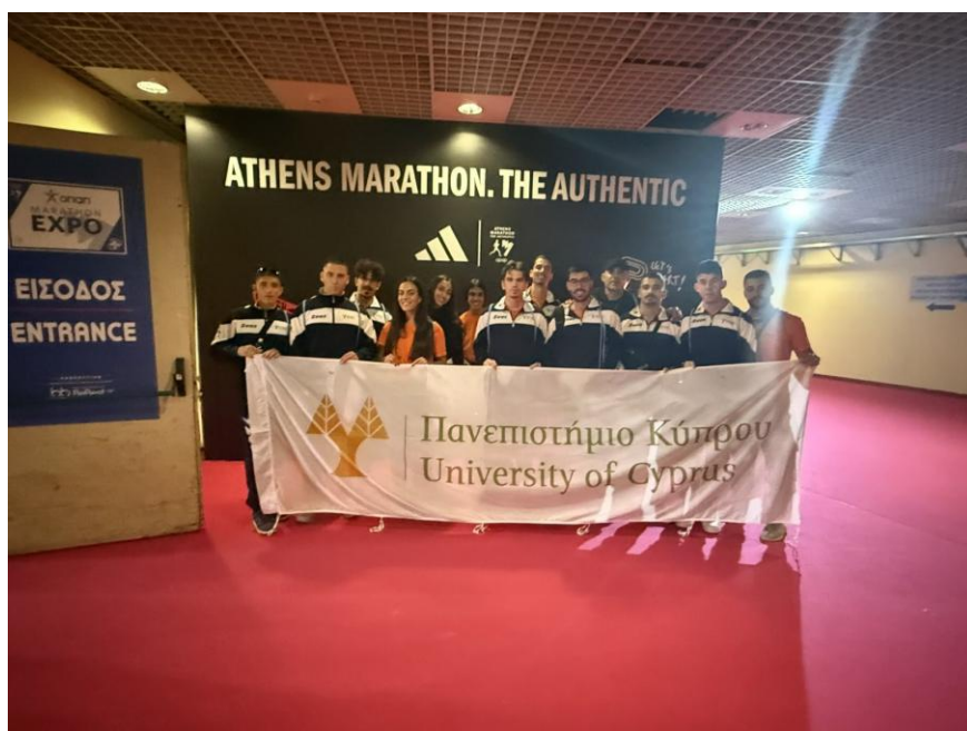
Επίσκεψη στο Κλειστό Παλαιού Φαλήρου (Ταε Kwon Do)