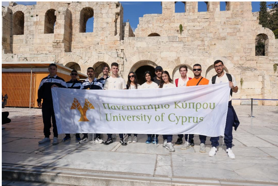
Επίσκεψη Ωδείο Ηρώδου του Αττικού