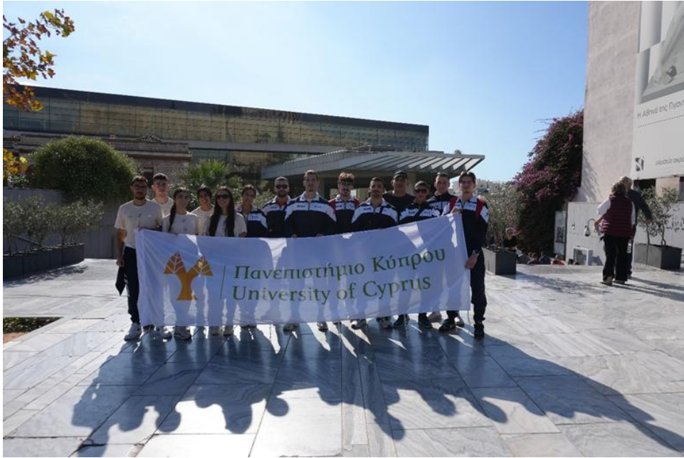
Επίσκεψη στο Μουσείο Ακρόπολης