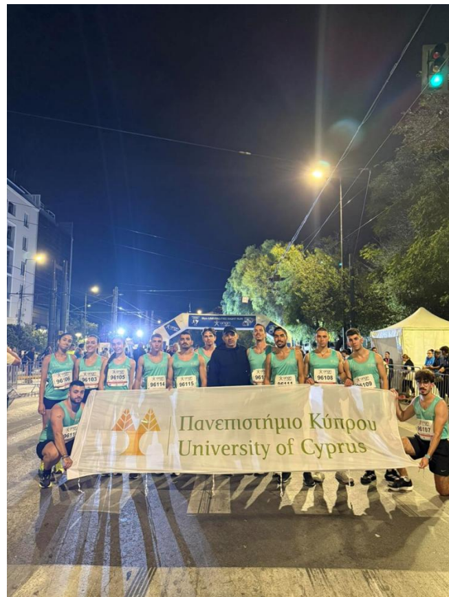
Αφετηρία αγώνα Εθνικός Κήπος Αθηνών