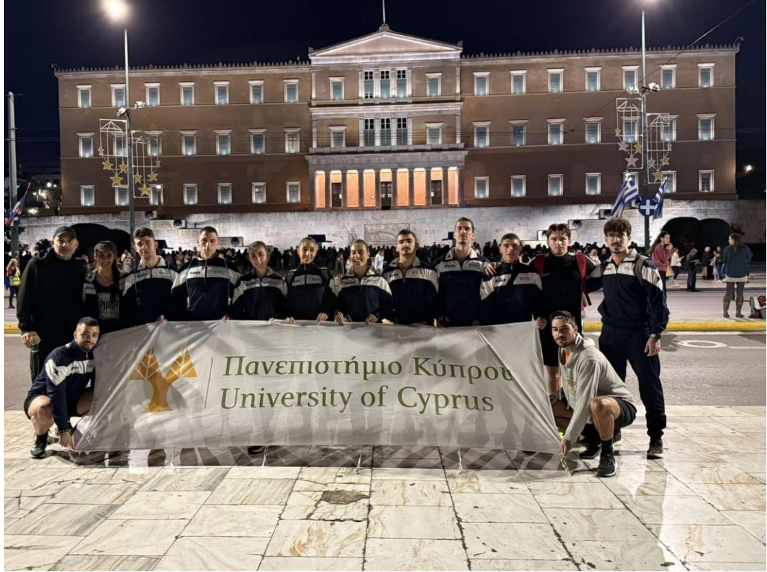
Επίσκεψη στο Σύνταγμα