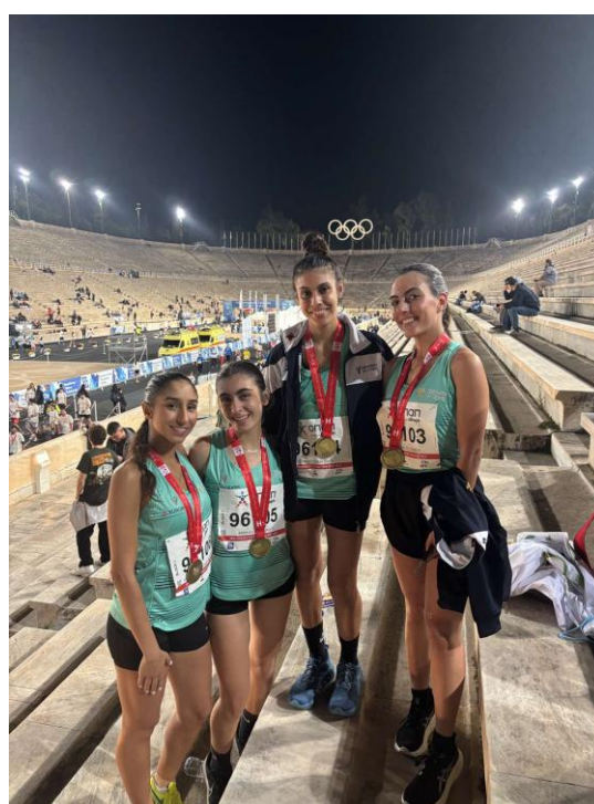
Τερματισμός στο Παναθηναϊκό Στάδιο γνωστό ως Καλλιμάρμαρο