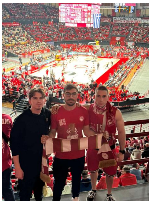
Επίσκεψη στο Στάδιο Ειρήνης και Φιλίας