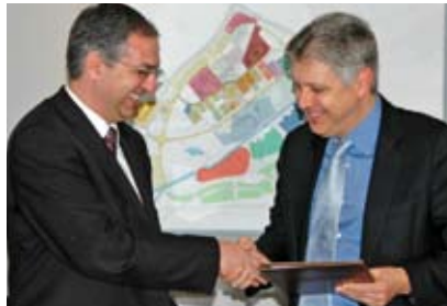
Ο τέως Υπουργός Υγείας κ. Κώστας Καδής με τον Πρύτανη, Καθηγητή Σταύρο Α. Ζένιο.

Με την υπογραφή του μνημονίου τα δύο μέρη στοχεύουν να καθιερώσουν ένα κοινά συμφωνημένο πλαίσιο συνεργασίας στους διάφορους τομείς υλοποίησης του Εθνικού Σχεδίου Δράσης Περιβάλλον και Υγεία του Παιδιού 2007-2010. Το Σχέδιο εκφράζει τη βούληση της Κυπριακής Δημοκρατίας να υλοποιήσει την πολιτική της Ε.Ε. και του Παγκόσμιου Οργανισμού Υγείας για τη μείωση των κινδύνων για την υγεία των παιδιών οι οποίοι προέρχονται από το περιβάλλον.