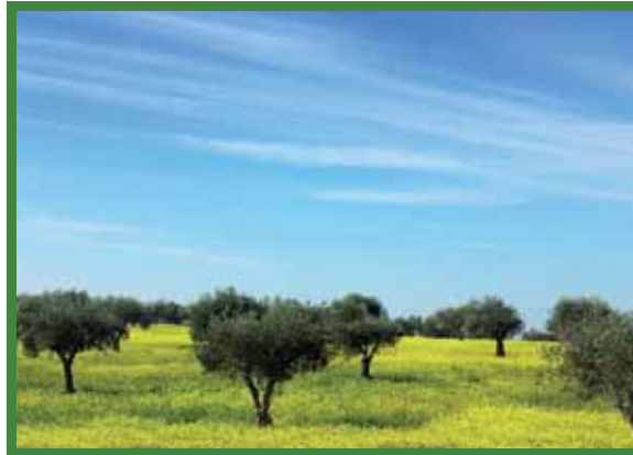
Mediterranean Cooperation in the Treatment and Valorisation of Olive Mill Wastewater