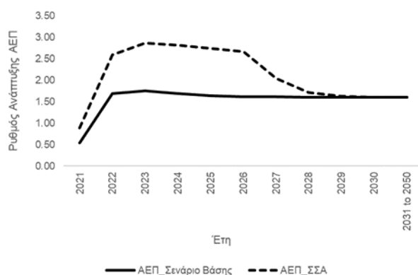
Διάγραμμα 1: Πρόβλεψη μεγέθυνσης του ΑΕΠ με βάση το ΣΑΑ και με βάση το σενάριο βάσης (χωρίς το ΣΑΑ)