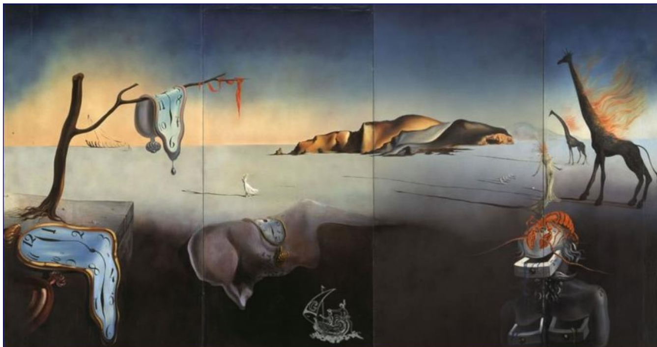
Salvador Dalí Le rêve de Vénus

© Salvador Dalí, Fundació Gala-Salvador Dalí, Figueres, 2007