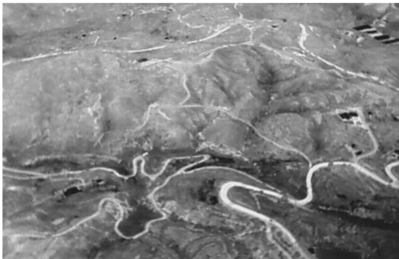
Εικόνα υψηλής ευκρίνειας από την περιοχή, η οποία λήφθηκε από τα μη επανδρωμένα αεροσκάφη του «Κοίος» κατά τη διάρκεια της νύχτας

Ένα θετικό πρώτο δείγμα γραφής της προαναφερθείσας συνεργασίας, η οποία ξεκίνησε πριν από μερικούς μήνες, δόθηκε κατά την πυρκαγιά στο χωριό Ορά της Επαρχίας Λάρνακας, την 19 η Ιουλίου 2017. Το συγκεκριμένο περιστατικό ανέδειξε έμπρακτα την αναγνώριση που δείχνει η Πυροσβεστική Υπηρεσία για επένδυση στην έρευνα και την καινοτομία, αλλά και στην χρήση έξυπνων τεχνολογικών εφαρμογών. Παράλληλα ήταν και μία πρώτης τάξεως ευκαιρία για το «Κοίος» να εφαρμόσει στην πράξη την τεχνολογία στην οποία εξειδικεύεται.