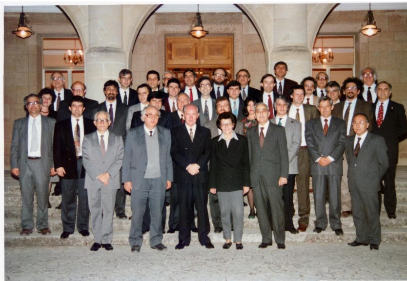
Φωτογραφία 1: Ο Πρόεδρος Γιώργος Βασιλείου με τα πρώτα μέλη της ακαδημαϊκής κοινότητας του Πανεπιστημίου Κύπρου, 1992.