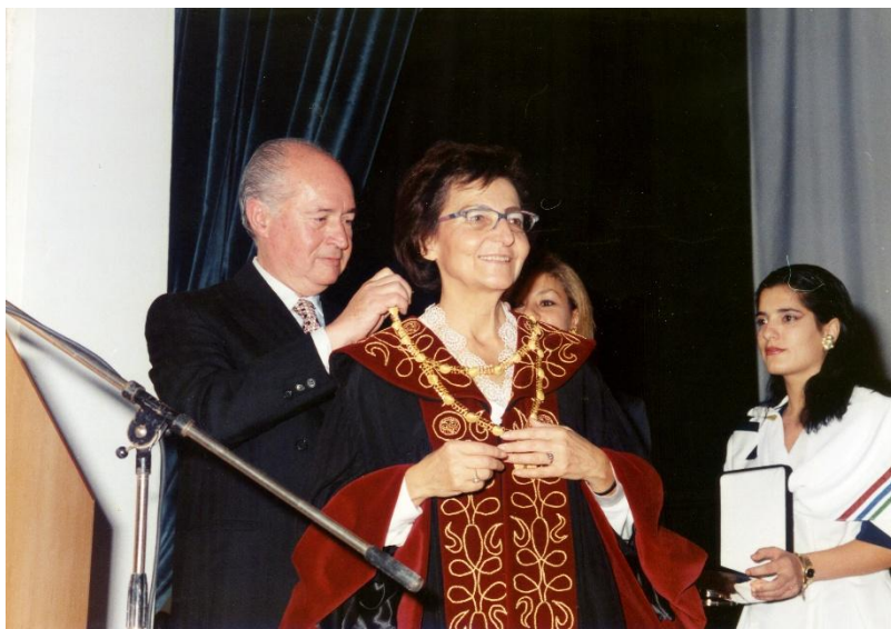
Φωτογραφία 2: Εγκαίνια και τελετή έναρξης του Πανεπιστημίου Κύπρου – Οκτώβριος 1992: Ο Πρόεδρος Γιώργος Βασιλείου παραδίδει τη χρυσή αλυσσο, διεθνές σύμβολο της αυτονομίας των πανεπιστημίων στην Πρόεδρο της Προσωρινής Διοικούσας Επιτροπής κα Νέλλη Τσιουγιοπούλλου.