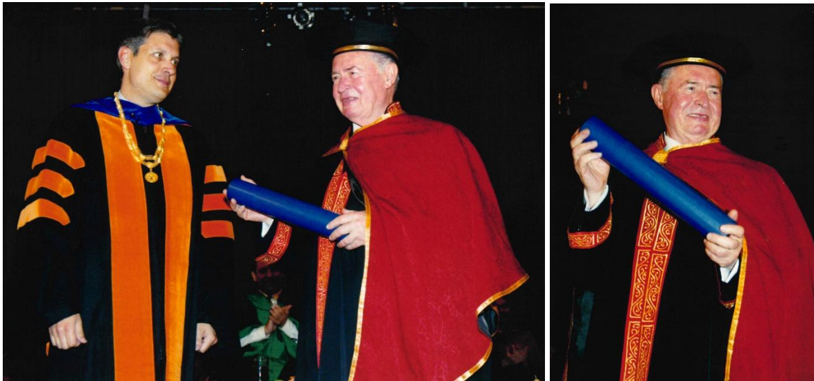
Φωτογραφία 6: Στιγμιότυπο από την Τελετή Αναγόρευσης του Γιώργου Βασιλείου σε Επίτιμο Διδάκτορα της Σχολής Οικονομικών Επιστημών και Διοίκησης. Στη φωτογραφία με τον Πρώην Πρύτανη Καθηγητή Σταύρο Ζένιο, 2003.