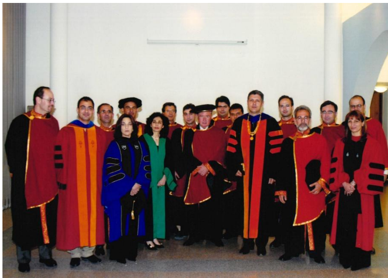
Φωτογραφία 7: Στιγμιότυπο από την τελετή Αναγόρευσης του Γιώργου Βασιλείου σε Επίτιμο Διδάκτορα της Σχολής Οικονομικών Επιστημών και Διοίκησης, μαζί με το ακαδημαϊκό προσωπικό της Σχολής, 2003.