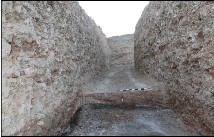
ΕΙΚ.4. Δυτική τομή και στο βάθος η κορυφή του τύμβου (ύψος 114 μ.). Διακρίνεται το πρώτο στρώμα θεμελίωσης του τύμβου πάνω σε στερεό γεωλογικό υπόβαθρο (ύψος 105,5 μ.).