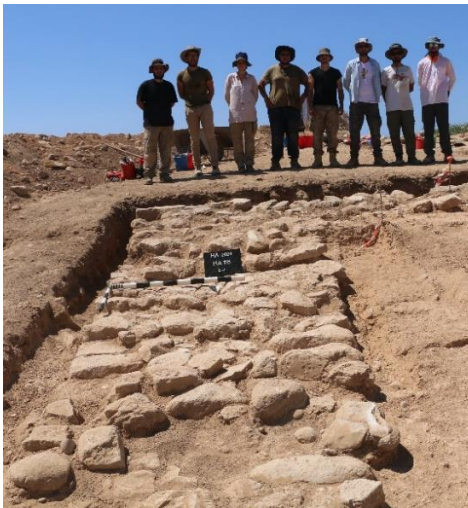
ΕΙΚ.11. Το νέο τμήμα του τείχους ανατολικά του ανακτόρου του Χατζηαπτουλλά.