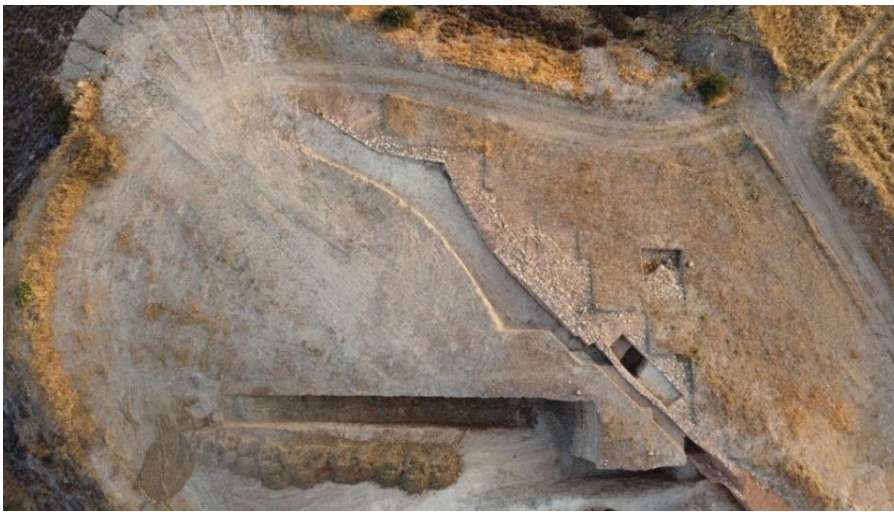
ΕΙΚ.5. Αεροφωτογραφία. Η τομή από την κορυφή προς τη δυτική άκρια της Λαόνας. Προς βορρά διακρίνεται η ΒΔ πορεία του τείχους.