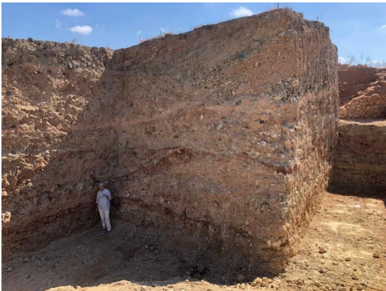
ΕΙΚ.6. Βόρεια και δυτική τομή κορυφής (ύψος 114μ.). Διακρίνονται, ανάμεσα σε στρώματα μάρμας, τα έντονα γήινα χρώματα των στρωμάτων πηλού με τα οποία είναι κτισμένος ο τύμβος. Στο βάθος διακρίνεται η βόρεια κλίμακα του τείχους της Λαόνας, οι κατώτερες βαθμίδες της οποίας παραμένουν εγκιβωτισμένες μέσα στην κορυφή του τύμβου.