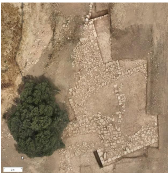
ΕΙΚ.12. Το νέο σύμπλεγμα (με διαφορετικό προσανατολισμό) που εντοπίστηκε στην εξωτερική πλευρά του ανατολικού τείχους ανάμεσα στη Λαόνα και το Χατζηαπτουλλά.