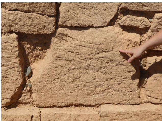
ΕΙΚ.14. Εγχάρακτα γκράφτι πλοίων σε λίθο του αρχαιότερου μνημείου.