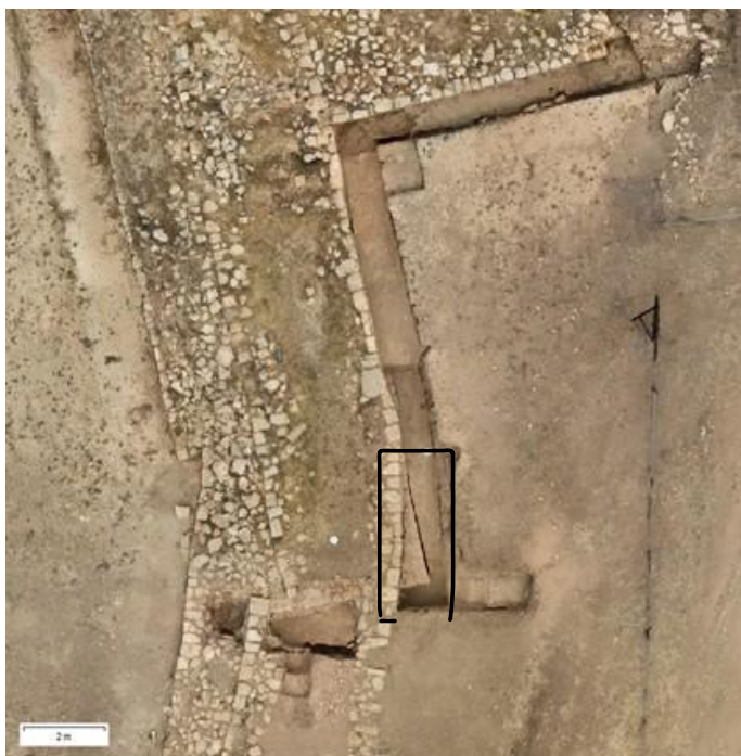
ΕΙΚ.13. Γωνία αρχαιότερου μνημείου που ενσωματώθηκε στο ανατολικό τείχος Λαόνας