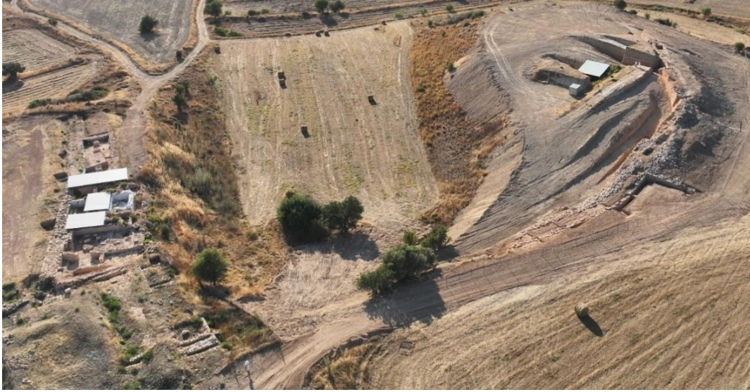
ΕΙΚ.7. Η αβαθής λεκάνη ανάμεσα στη Λαόνα (δεξιά) και το Χατζηαππουλλά (αριστερά) το 2023 πριν από τη διερεύνηση του ενδιάμεσου χώρου το 2024.