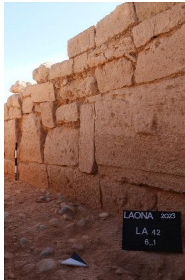
ΕΙΚ.8 α-β. Πορεία ανατολικού τείχους Λαόνας προς νότο – προς οροπέδιο Χατζηαππουλλά