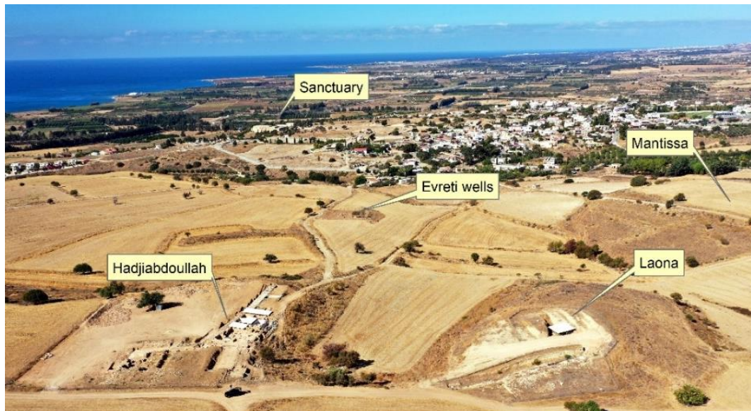
ΕΙΚ.1. Το τοπίο της αρχαίας πολιτείας ανατολικά του ιερού