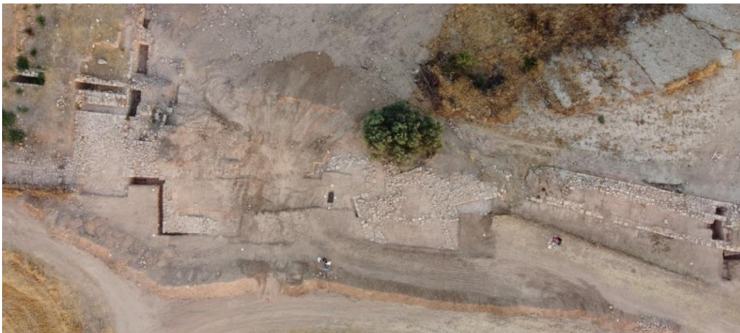
ΕΙΚ.9. Ο ενδιάμεσος χώρος μετά τη διερεύνηση του 2024: στα αριστερά η νέα προέκταση του ανατολικού τείχους του ανακτόρου, στα δεξιά το ανατολικό τείχος της Λαόνας και, στο ενδιάμεσο, το νέο σύμπλεγμα με διαφορετικό προσανατολισμό και σε χαμηλότερο επίπεδο.