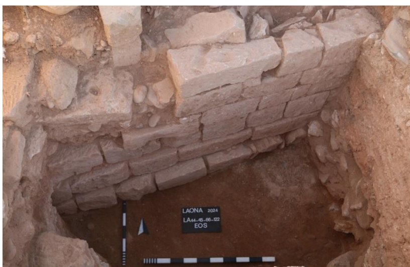
ΕΙΚ.15. Το αρχαιότερο μνημείο κάτω από το τείχος Λαόνας.