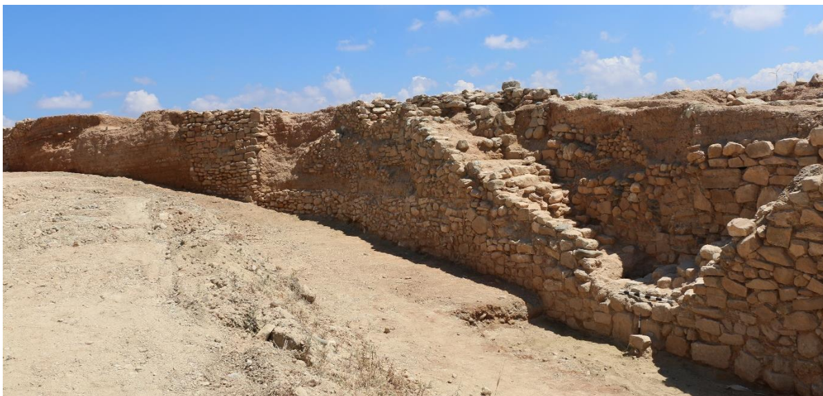
ΕΙΚ.3 Εσωτερική όψη ανατολικού τείχους Λαόνας που είχε σκεπαστεί από τον τύμβο.