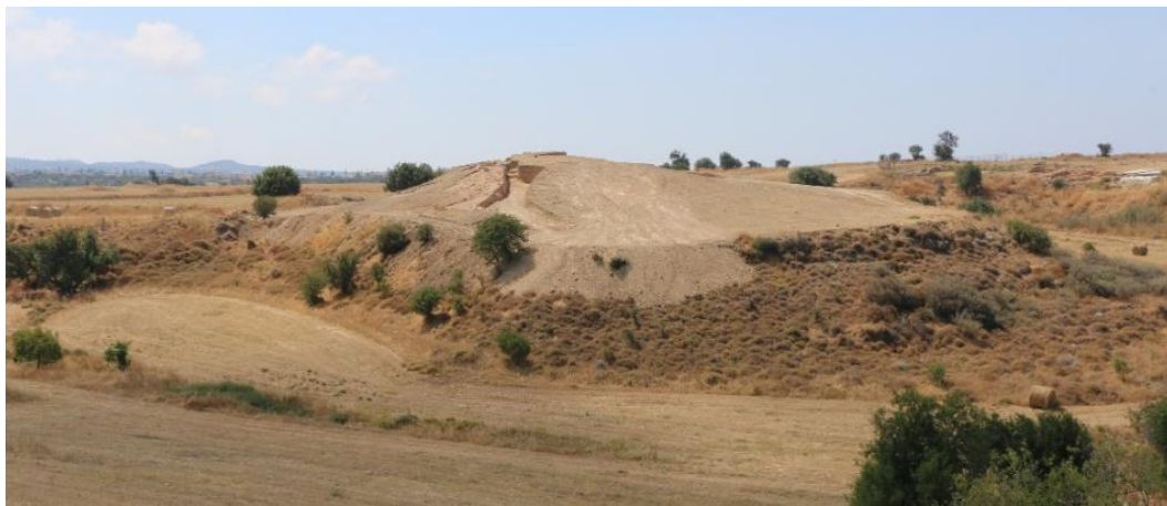
ΕΙΚ.2. Βόρεια και ΒΔ όψη τύμβου Λαόνας