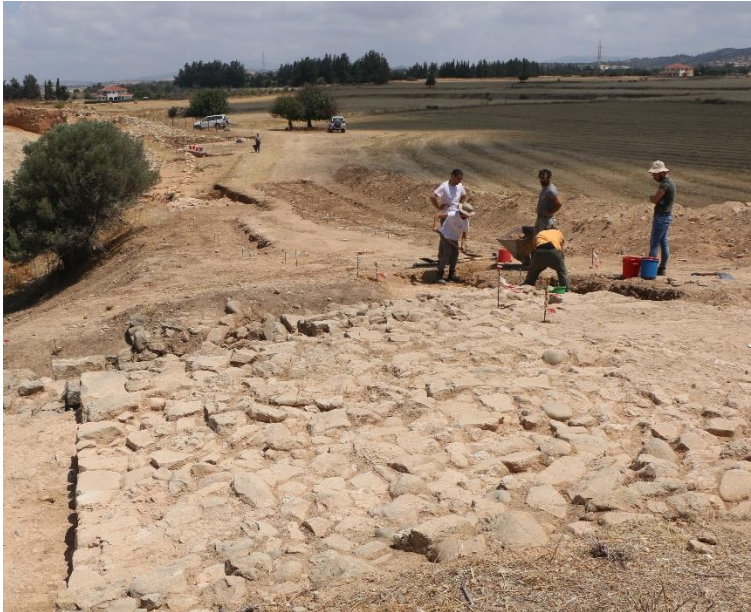
ΕΙΚ. 10. Βάση πύργου στη βόρεια όψη ανακτόρου Χατζηαπτουλλά