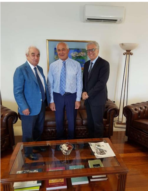
Φωτογράφια, Πρύτανης Βασίλειος Χρυσικόπουλος, Πρύτανης Κωνσταντίνος Χριστοφίδης, Αντιπρόεδρος του Συμβουλίου του Παν. Κύπρου Γιώργος Δαβίδ

Το Πανεπιστήμιο Ιονίου, το οποίο εδρεύει στην Κέρκυρα επισκέφθηκαν την Πέμπτη, 27 Ιουλίου ο Πρύτανης του Πανεπιστημίου Κύπρου Καθηγητής Κωνσταντίνος Χριστοφίδης και ο Αντιπρόεδρος του Συμβουλίου του Πανεπιστημίου Κύπρου κ. Γιώργος Δαβίδ. Σκοπός της επίσκεψης ήταν η υπογραφή συμφωνίας ανάμεσα στα δύο πανεπιστήμια για την προώθηση της συνεργασίας στους τομείς της διδασκαλίας, της έρευνας και του πολιτισμού.